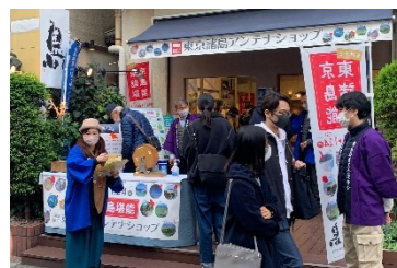
※吉祥寺でのオープン初日の店頭の様子

第1弾「吉祥寺」は、約1カ月間で来店者6000人超の大盛況「吉祥寺」の出店(2020年12月12日～2021年1月24日)では約1カ月間で延べ約6,000人超が来店。さらに、吉祥寺の地元媒体をはじめとする数々のメディアで取り上げられ、注目を集めました。